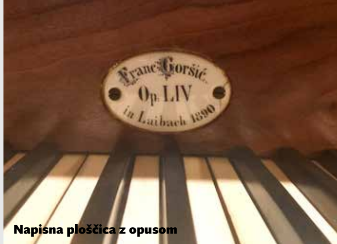
Napisna ploščica z opisom