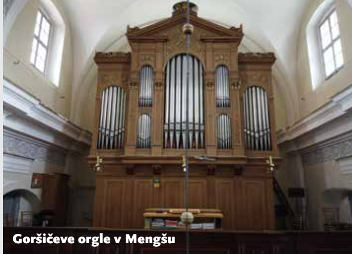
Goršičeve orgle v Mengšu